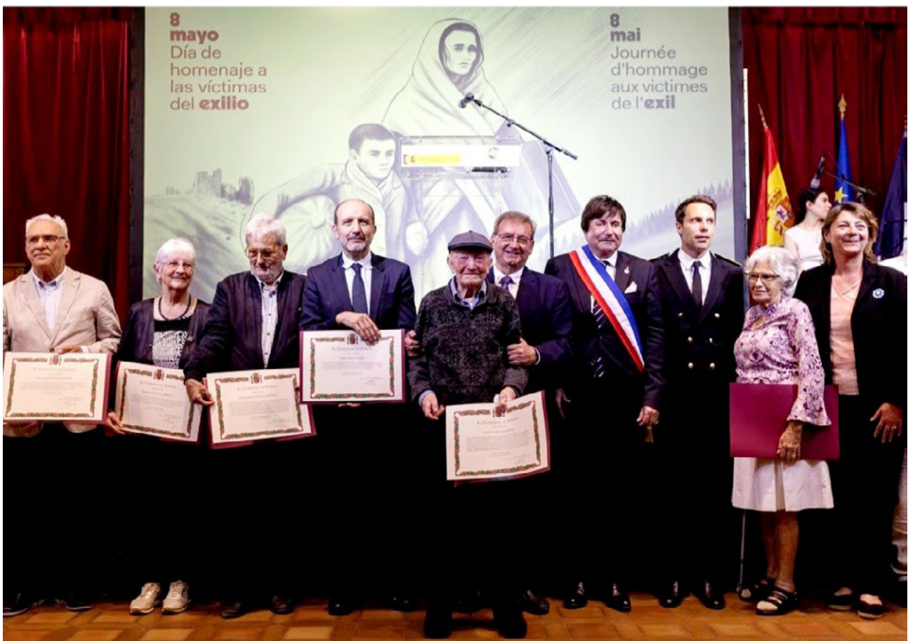
Representantes del exilio y la resistencia republicana posan junto a las autoridades españolas y francesas tras recibir la declaración de reconocimiento del Estado.

Sin dudarlo, hombres y mujeres se unieron a la resistencia y crearon partidas de guerrilleros que combatieron sin descanso por la libertad. Estos combatientes fueron el germen de la resistencia francesa al régimen colabora-