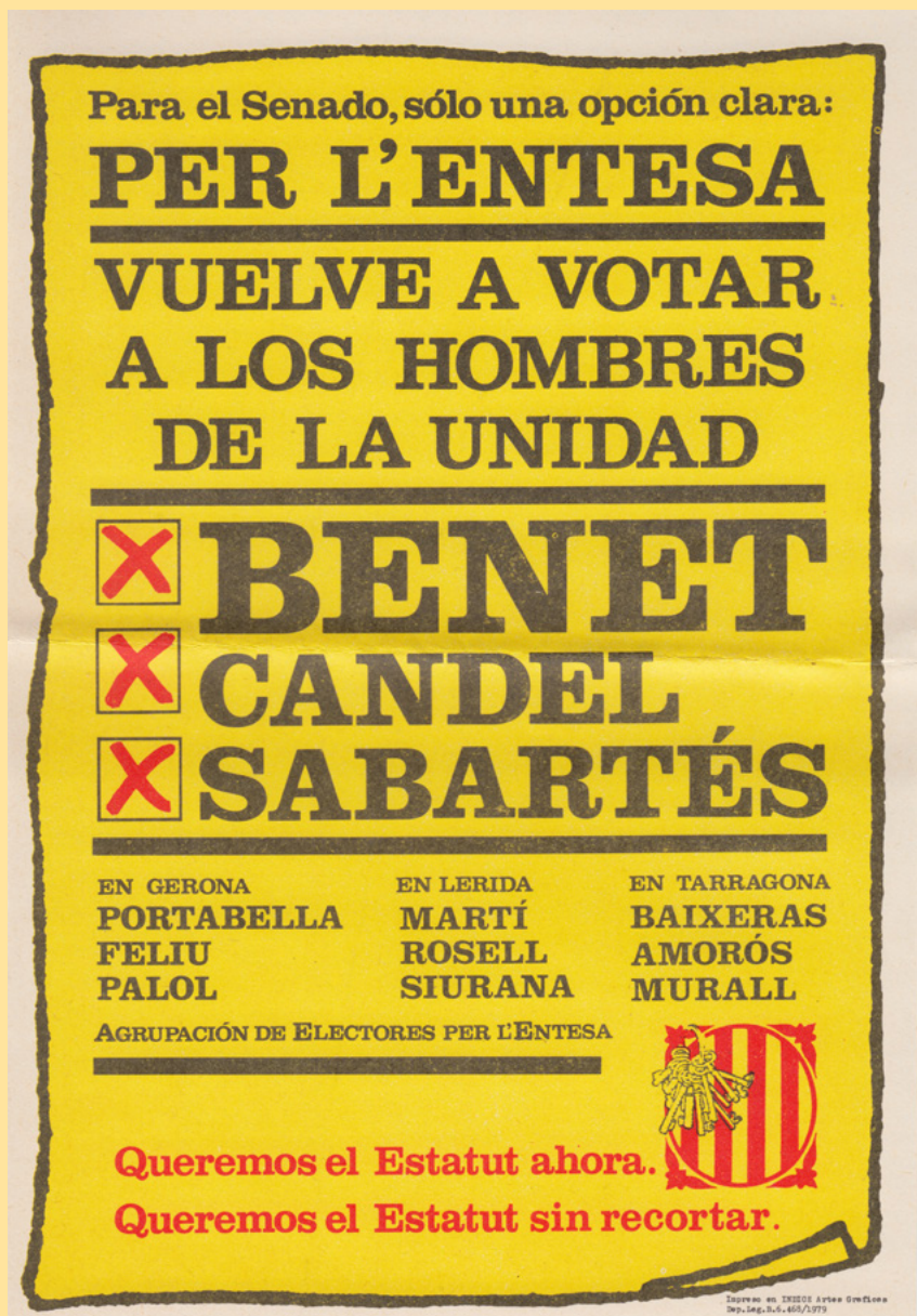
Propaganda. Cartell demanant el vot a la candidatura pel Senat. Barcelona, 1979.